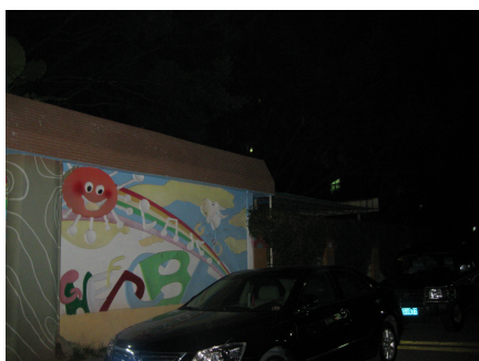
有白光照明灯的夜视监控视频画面